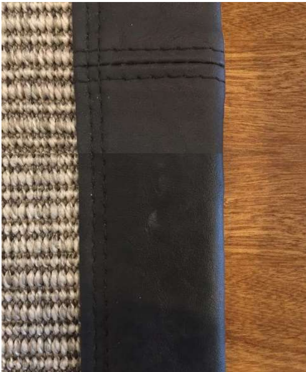
Alfombra con borde de cuero y doble costura

Ver detalles y medidas en “Planilla de alfombras”